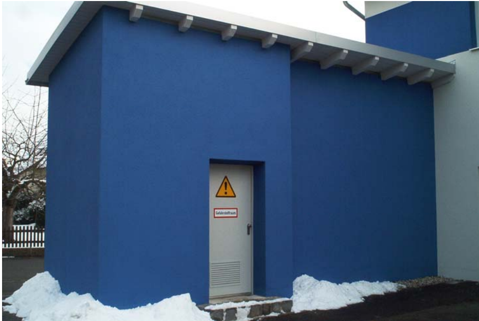
Gefahrstoffraum – Anbau am Verwaltungs- und Werkstattgebäude