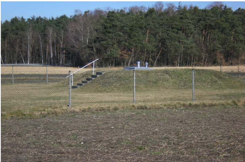
Brunnen I Klardorf

In der Wasserversorgung will man die optische Beeinträchtigung der Landschaft durch Gebäude und Schächte für Brunnen, Druckpumpwerke und Sicherheitsumzäunungen, etc. minimieren. Wir wollen soweit möglich an die Umwelt angepasste Einrichtungen errichten bzw. unterhalten. Dennoch soll dem Sicherheitsaspekt Rechnung getragen werden. Ein wichtiger Bestandteil ist die Kenntnis der örtlichen Bevölkerung über die Wasserversorgungseinrichtungen. Diese wird bei Führungen oder gelegentlichen Informationsveranstaltungen über diese Bauten unterrichtet. Im Fassungsbereich vom Brunnen I Klardorf wurden die vorhandenen Birken entfernt. Von den 7 Birken hatten vier Stammfäule, von zwei Birken wanden sich die Wurzel um die Brunnenleitung und führten zu Beschädigungen und einem Rohrbruch. Bei einer Besichtigung des Gesundheitsaufsehers am 14. Dezember 2006 wurde die Beseitigung der noch vorhandenen Wurzelstöcke bis zum 30. April 2007 empfohlen. Dieser Zieltermin wurde natürlich eingehalten.