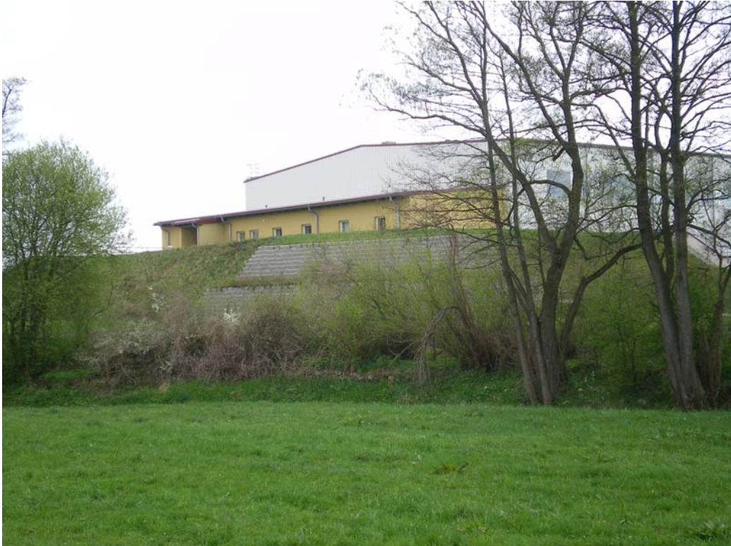
Ansicht der Aufbereitungsanlage von der Straße nach Irlaching

Seit 2005 können die Rückstände von den Reinigungsschlämmen umweltfreundlich, als wieder verwertbarer Rohstoff entsorgt werden. Eine Behandlung in einer Sondermüllleinrichtung ist nicht mehr notwendig.