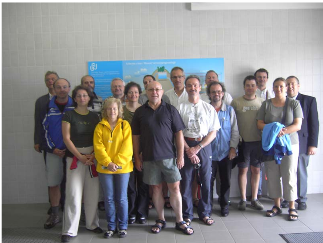
Besuch vom Umweltausschuss des Bayerischen Beamtenbundes