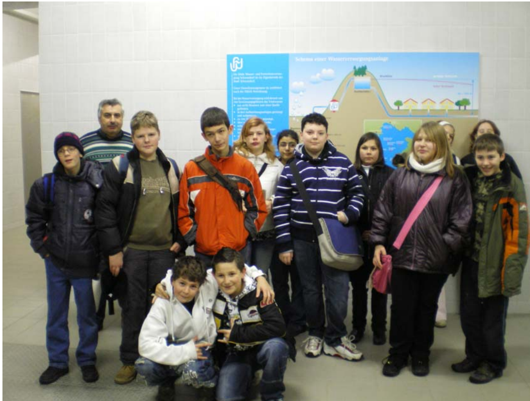
Besichtigung durch eine Klasse der Lernförderschule