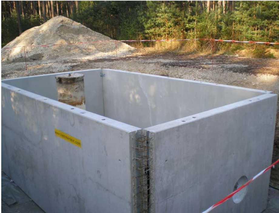
Brunnen I Kreither Forst

3. Die Einleitung von Rückspül- und Überwässern in öffentliche Gewässer soll soweit wie möglich minimiert werden und die genehmigten Schmutzwasserfrachten eingehalten werden.